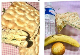
Une Lunche box fait maison

diner du soir dans un restaurant 18,50€/personne